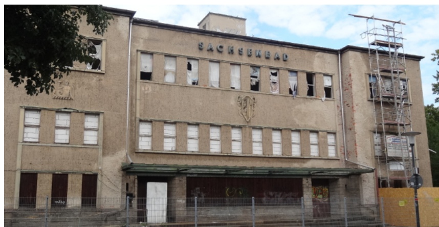
Sachsenbad: Mit einer Konzeptausschreibung soll ein privater Investor für das Sachsenbad in Pieschen gefunden werden.