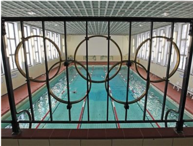
Die Schwimmhalle in Klotzsche ist dringend sanierungsbedürftig